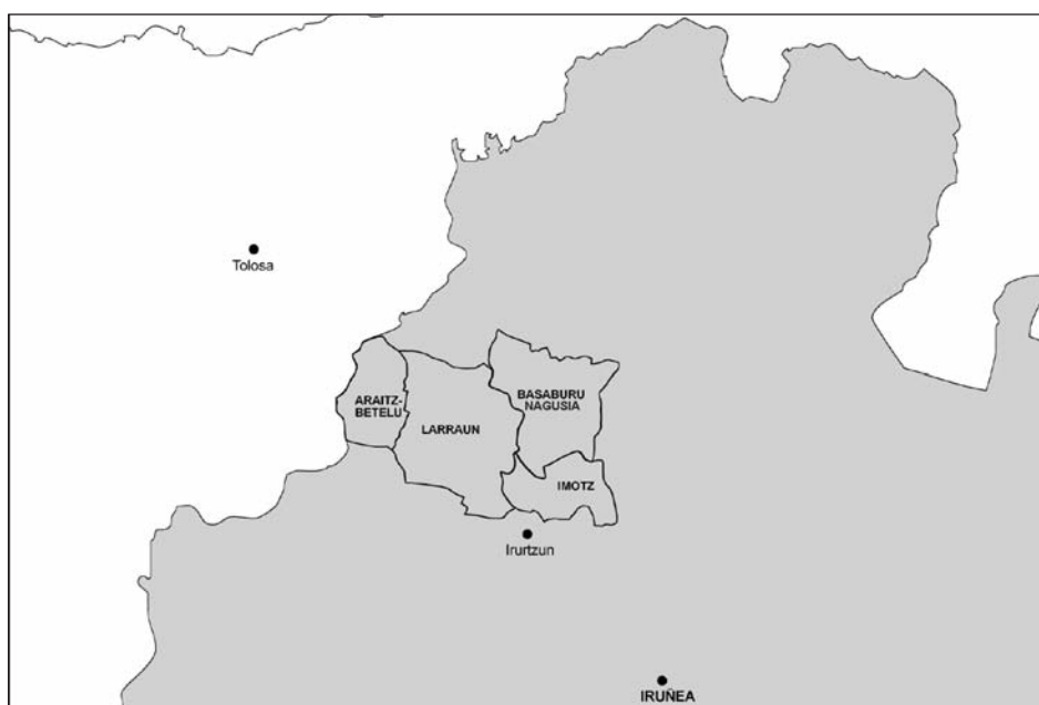
1. irudia: Imotz, Basaburu Nagusia, Larraun eta Araitz-Betelu ibarren kokapena. Egilea: G. Martin

1.1. Nafarroa Garaiko ipar-mendebalean dauden lau ibarretako euskara izango dugu aztergai saio honetan: Imotz, Basaburu Nagusia, Larraun eta Araitz-Betelu. Euskal Herriko erdigunean daude lau ibar horiek, Iruñea eta Tolosa lotzen zituen bide zaharrea bete-betean kokaturik.