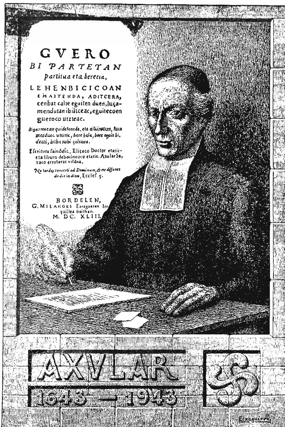
Retrato imaginario de Axular