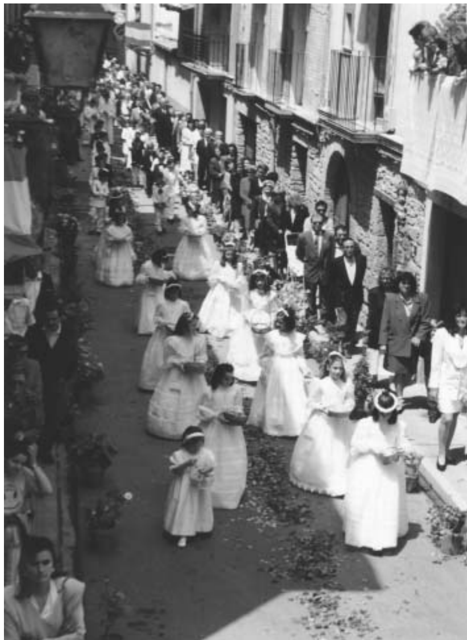
Niños y niñas de Primera Comunción en la procesión del Corpus.