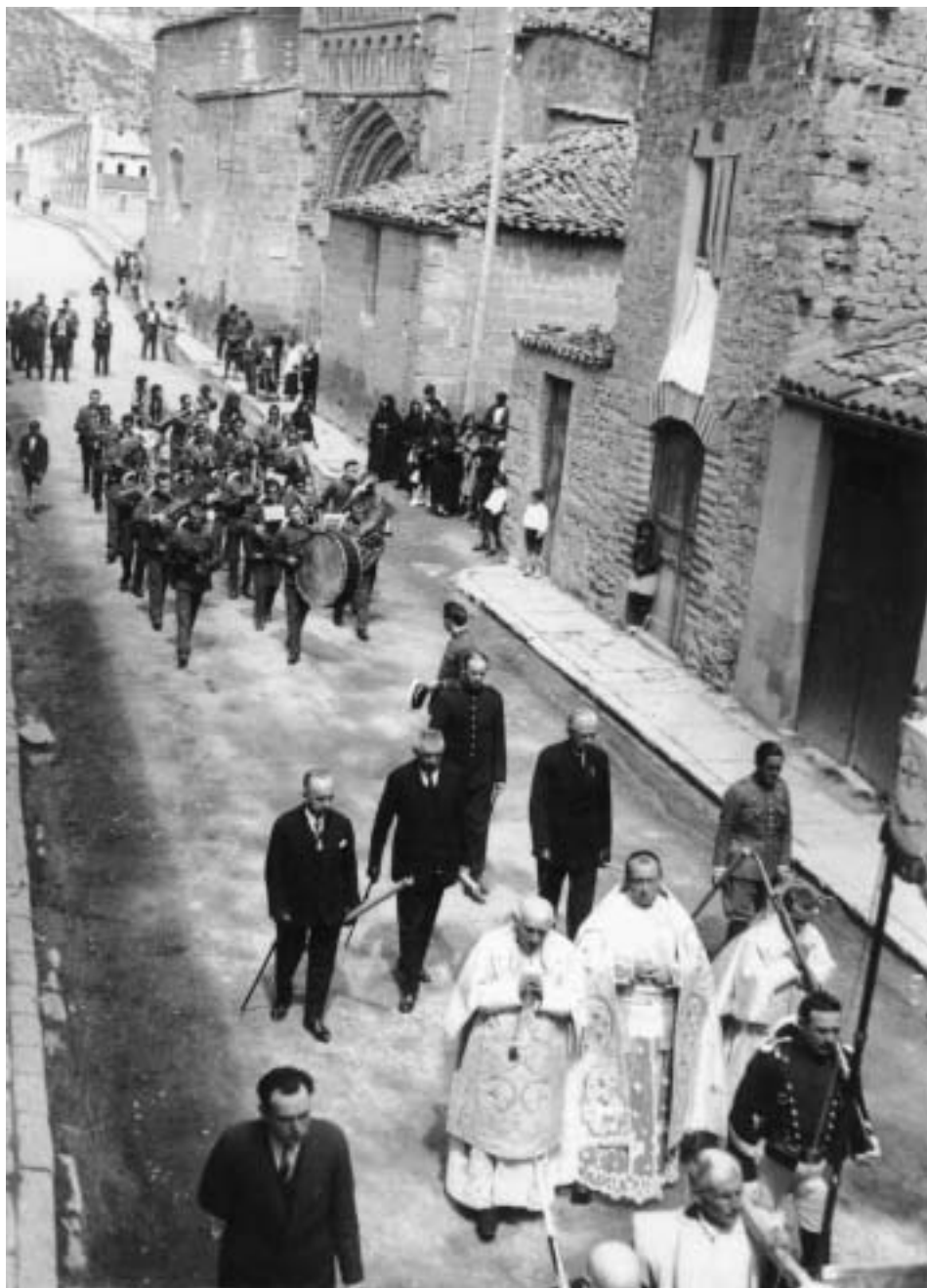
Procesión del Corpus. Año 1928.