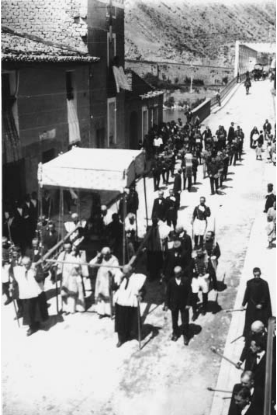
Procesión del Corpus, año 1927.