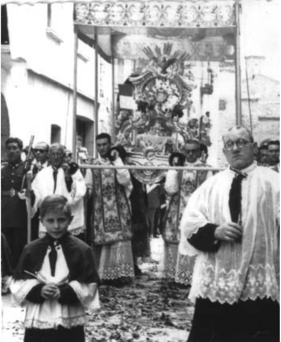
Procesión del Corpus con la custodia de la parroquia de Santiago hacia 1958.