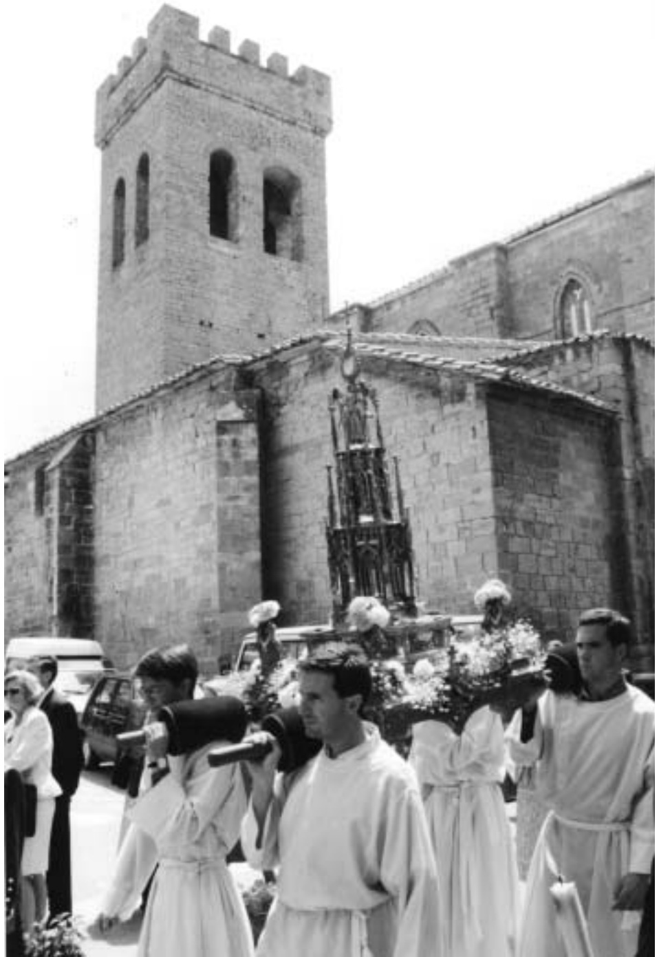
Procesión del Corpus con la custodia de Santa María.