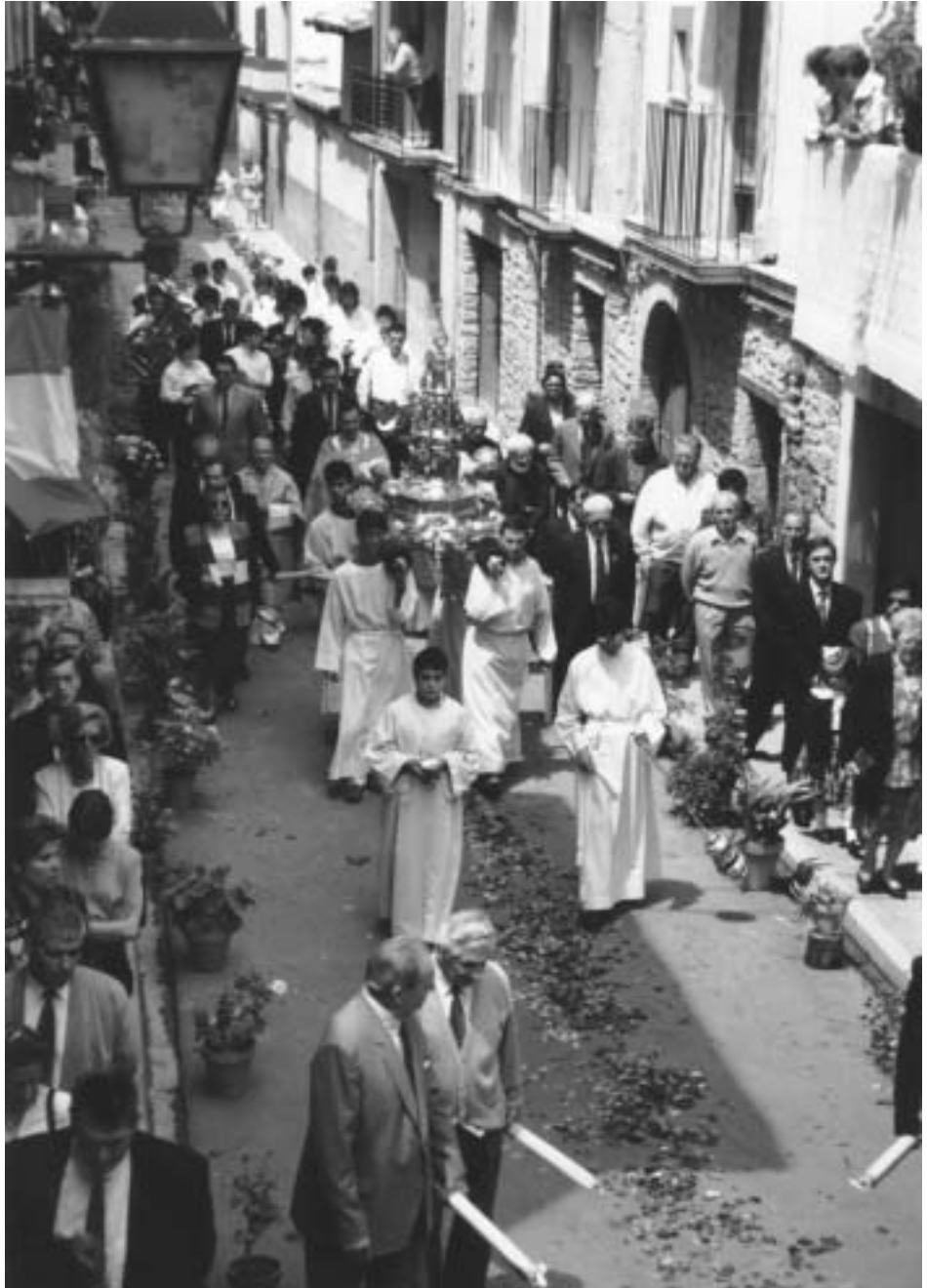
Procesión del Corpus con la custodia de Santa María, con asistencia del Ayuntamiento y de la Banda Municipal.