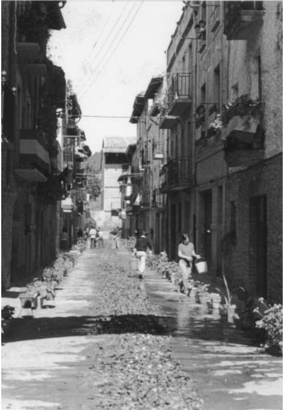
Vecinas de la Calle Amadores adornando la calzada para la procesión del Corpus.