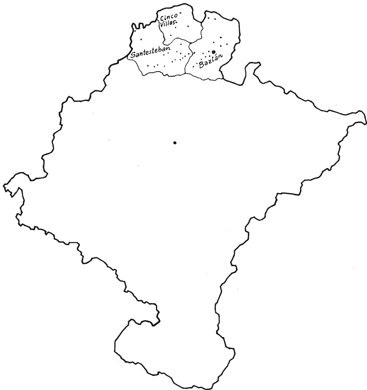
Mapa de Navarra en el que aparecen indicadas las poblaciones estudiadas.