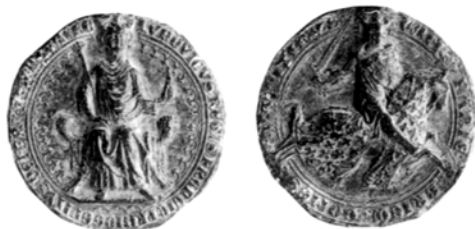
Sello de Luis el Hutín Anverso y Reverso