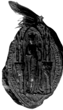
Sello de la reina Juana I.

Documentos financieros para el estudio de la Hacienda Real de Navarra