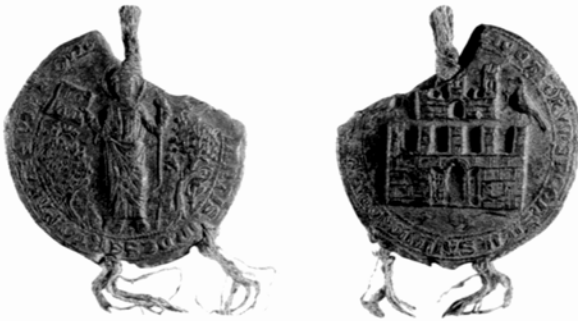
Sello de Concejo de S. Juan Pie de Puerto Anverso y Reverso

Documentos financieros para el estudio de la Hacienda Real de Navarra