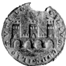
Sello del Concejo de Tudela

Documentos financieros para el estudio de la Hacienda Real de Navarra